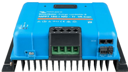
SmartSolar Laadcontroller MPPT 150/100-Tr VE.Can zonder beeldscherm