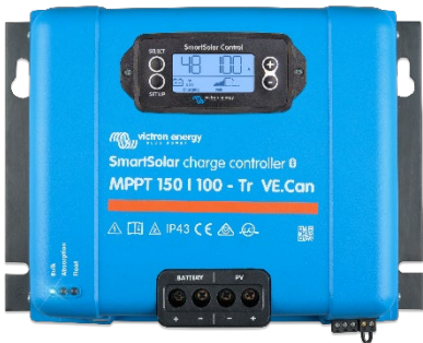
SmartSolar Laadcontroller MPPT 150/100-Tr VE.Can met optioneel insteekbaar beeldscherm