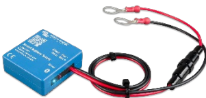
Bluetooth-waarneming: Smart Battery Sense