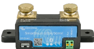
Bluetooth detectie: SmartShunt