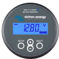
Bluetooth-waarneming: BMV-712 Smart Battery Monitor