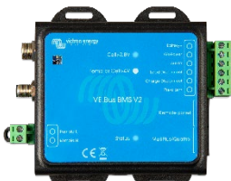
VE.Bus BMS V2