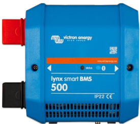
Lynx Smart BMS