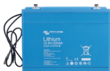
Lithium Battery Smart 12,8 V & 25,6 V