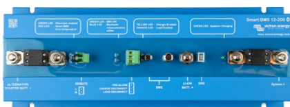
Smart BMS 12/200